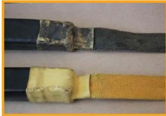
[그림 5] 이력을 알 수 없는 두 개의 유사한 제품 (상단 웨빙 짐줄 부분이 심하게 더럽혀짐)