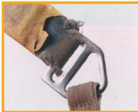
[그림 3] D링 연결 부분의 충격흡수장치 끝 부분의 손상