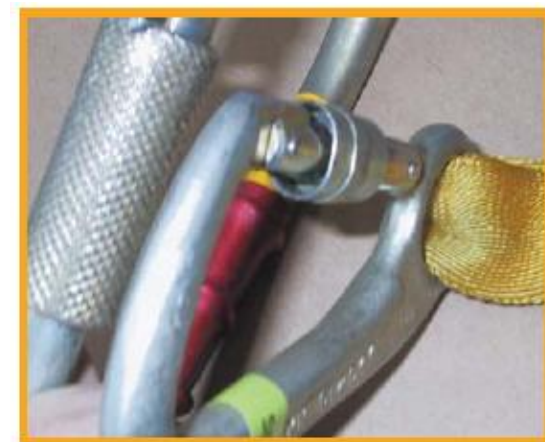
[그림 7] 카라비너의 게이트(Gate)가 손상됨