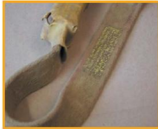
[그림 8] 라벨이 없어짐 (충격흡수장치의 보호 슬리브가 손상됨)