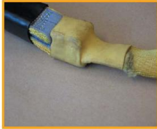
[그림 2] 충격흡수장치 근방의 굽힘 손상 (충격흡수장치의 보호 슬리브(Sleeve)의 위치가 옮겨짐)