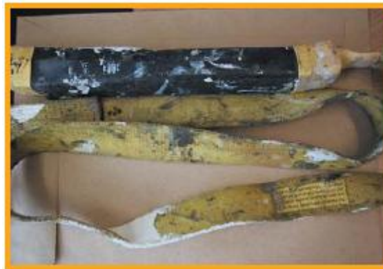
[그림 6] 웨빙 짐줄이 페인트로 심하게 오염됨