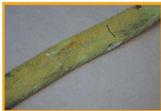
[그림 4] 굽힘에 의한 표면 섬유 손상